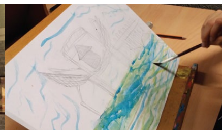
INFO E PRENOTAZIONI

Il Museo delle Genti d'Abruzzo si trova in via delle Caserme 24, nel cuore di Pescara Vecchia, vicino la casa natale di Gabriele d'Annunzio e nei pressi della Cattedrale di San Cetto.