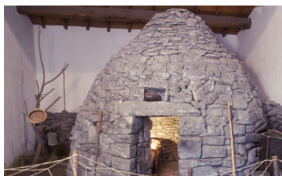
ORARI DI APERTURA

Si segnala inoltre che quest'anno, grazie alla collaborazione avviata con la Stem@it (Science, Technology, Engineering, Mathematics) , è possibile concordare dei percorsi integrati che coinvolgano le discipline scientifiche e tecnologiche.